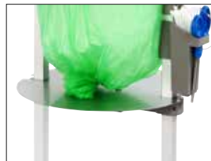
Placa ajustable para Stand Classic Mini Item no. 31480 Reduce el consumo de material y el tamaño de las bolsas. Destinado principalmente para su uso con desechos pesados. Los casetes de bolsas Bio se pueden utilizar con ventaja