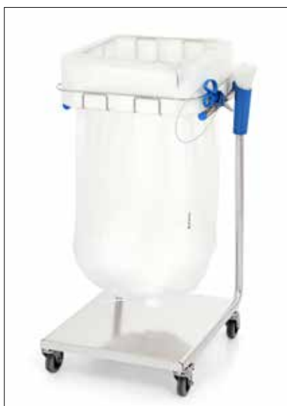
Stand Dynamic Midi/Midi Pedal