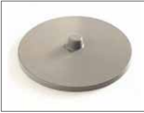
Tapa para Longopac Stand Classic Maxi y Mini Mini. Item no. 31140 Maxi. Item no. 30140