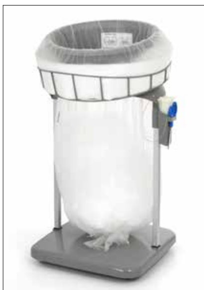
Stand Classic Maxi/Maxi Food