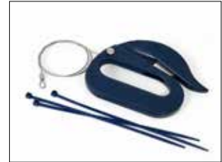
Kit de Seguridad Cutter Azul. Item no. 30440 Contiene un cortador de seguridad en PP con detección de metales, así como un alambre de acero inoxidable y en bridas de PA con detección de metales.