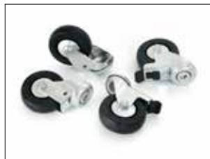
Kit de tijeras para Longopac Stand Dynamic Item no. 34616 Incluye cuatro ruedas giratorias, dos de ellas con frenos. Reemplaza las ruedas originales en los soportes utilizados en áreas restringidas de ESD.