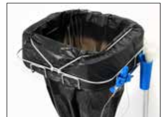
Banda elástica Item no. 3102 Este accesorio se puede utilizar con todos los portabobinas (bastidores) de Longopac. Bloquea eficazmente la bobina (bolsa) y evita que se despliegue.