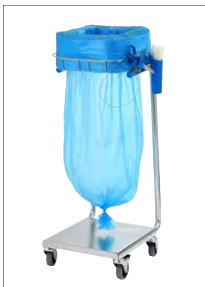
Stand Dynamic Mini/Mini Pedal