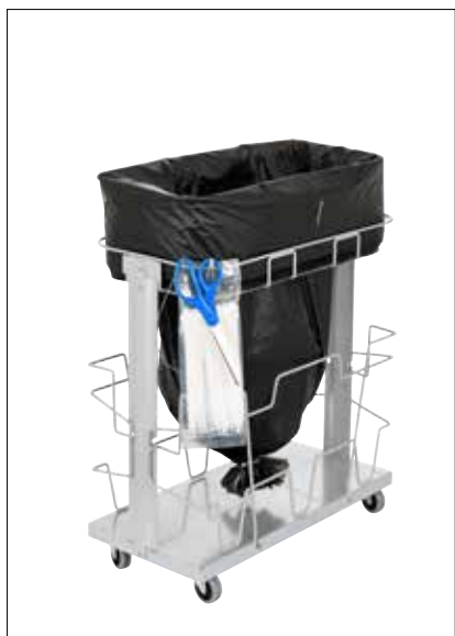
Stand Dynamic UBS