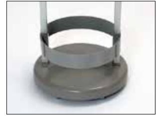
Marco para Longopac Stand Classic Mini Item no. 33890 El marco mantiene la bolsa en su sitio.